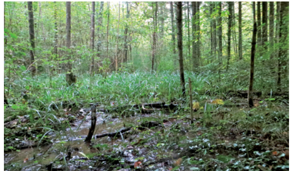
Die Hobby-Ornithologen und -Ornithologinnen, welche mit ihren Beobachtungen das Avimonitoring überhaupt erst ermöglichen, halten in ganz unterschiedlichen Lebensräumen nach Brutvögeln Ausschau.

als «Zürcher Brutvogelatlas» im Regal vieler naturkundlich interessierter Zürcher. Eine Erkenntnis des ersten Zürcher Brutvogelatlas war, dass zahlreiche seltene, gefährdete Brutvogelarten ausserhalb der Schutzgebiete leben, z.B. als Gebäudebrüter, und nur mit speziellen Artförderungsprogrammen zu erhalten sind (s. Seite 15). Schliesslich war der Atlas eine robuste Grundlage für eine Wiederholung nach 20 Jahren und der Darstellung der raschen Veränderungen (Wegglar et al. 2009).