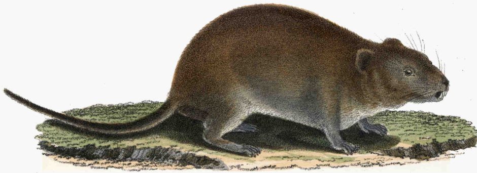
Die Nagersche Feldmaus. Hypudaeus Nageri.