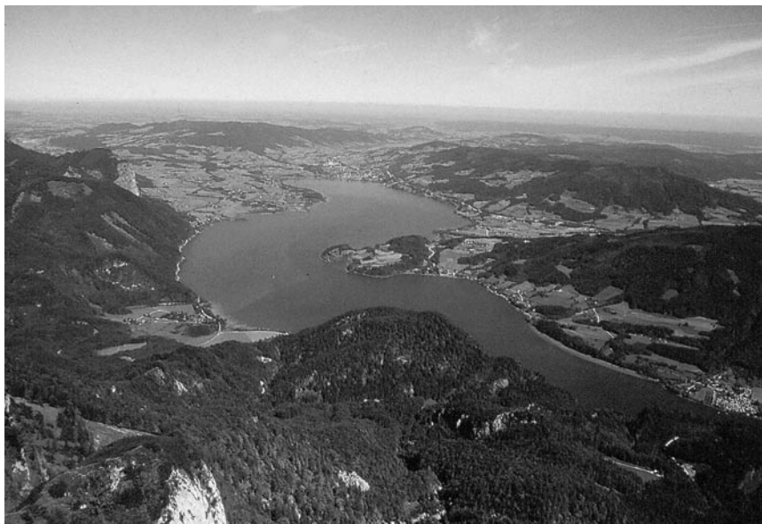
Abb. 1. Aussicht vom Schafberg (1783 m ü. M.) auf den Mondsee (481 m ü. M.) im Salzammergut. Foto: E. Hübl, Juni 2002.