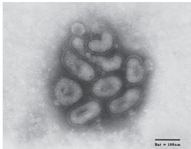
Abb. 1. Elektronenmikroskopische Darstellung von Influenza-A-Viren.

Influenza-A-Viren kommen in einer Vielzahl von Säugtieren, bei Vögeln und auch beim Menschen vor, bei dem sie unterschiedlich schwere Krankheitssymptome verursachen. Die Stämme, welche auf den Menschen spezialisiert sind, können je nach der Beschaffenheit ihrer Oberflächenproteine Epidemien verursachen oder aber die Ursache von