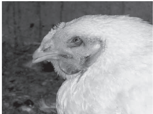
Abb. 4. Ein an H7N7 erkranktes Huhn. Die Tiere weisen einen schlechten Allgemeinzustand auf.

Die hochpathogene Variante der Geflügelpest wird ausschliesslich durch die Virus-Subtypen H5 oder H7 verursacht. Diese können mit unterschiedlichen Neuraminidase-Subtypen (N-Subtypen) kombiniert werden. Da das Virus bei den Tieren innert kurzer Zeit zu zahlreichen Todesfällen führt, rasch von Betrieb zu Betrieb verschleppt werden kann, sowie keine natürlichen Grenzen kennt, ist